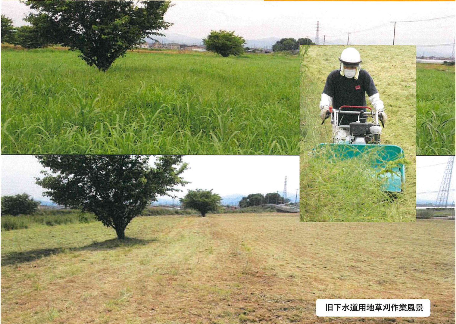
旧下水道用地草刈作業風景